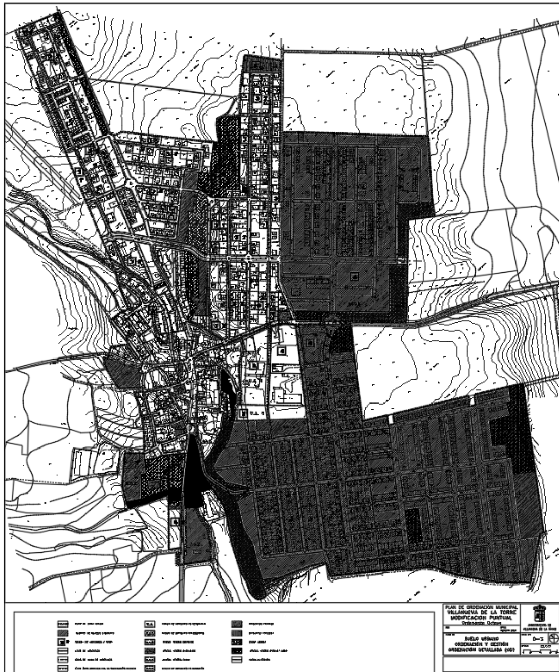
O.3a SUELO URBANO.ORDENACIÓN Y GESTIÓN. PLANO DETALLE ÁMBITO ORDENANZA 8ª