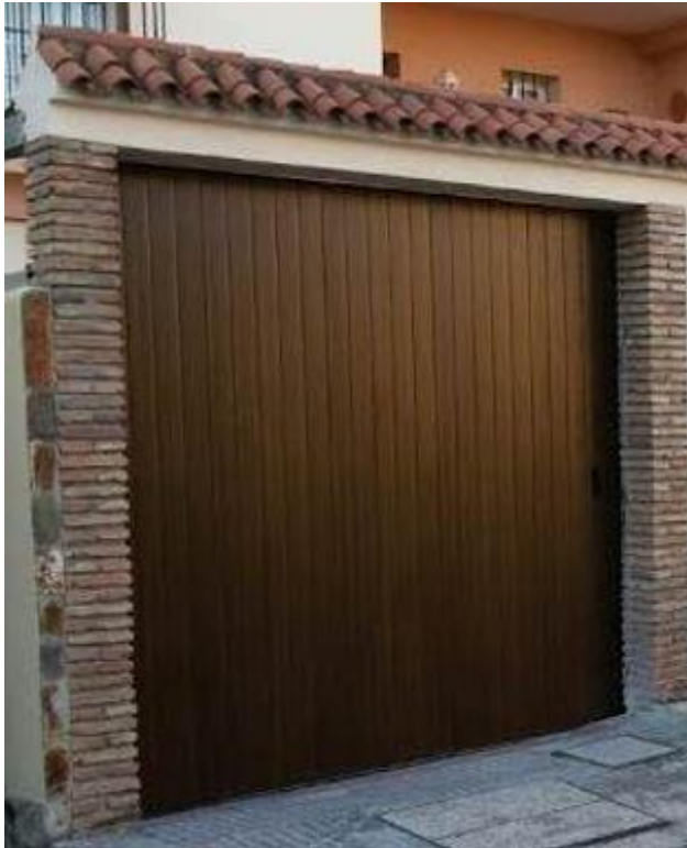
1.5 Sistema de recogida de la puerta seccional lateral (vertical).