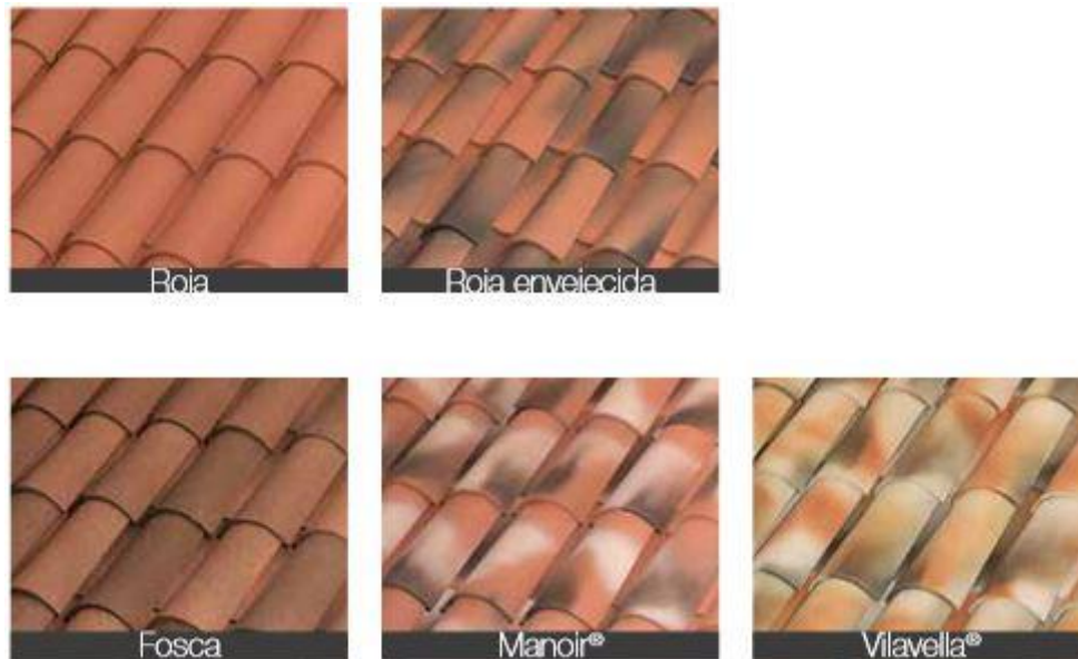
Imagen 1. Ejemplos de tejas permitidas envejecidas y no permitidas.

En el caso de reforma parcial de la cubierta, tendrán que mantenerse las características originales y/o tradicionales de la misma, con relación a su material, color y tipo de teja, no pudiéndose modificar las pendientes originales, salvo que ésta permita subsanar un problema de conservación, siempre que no se trate de un edificio expresamente protegido.