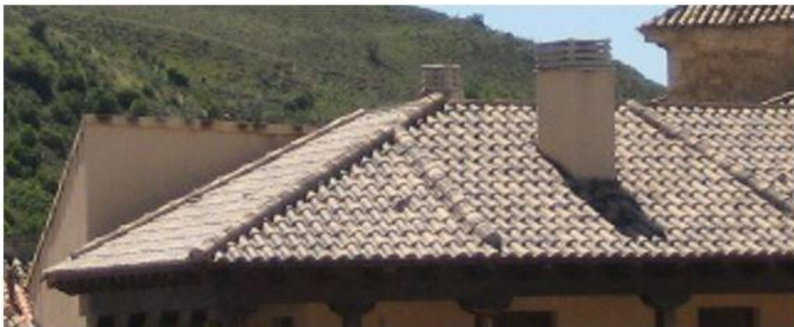
Imagen 2. Ejemplo de chimenea no permitida

Las chimeneas existentes que no se ajusten a lo anteriormente expuesto, se adaptarán cuando se realicen obras para la reparación total de la cubierta.