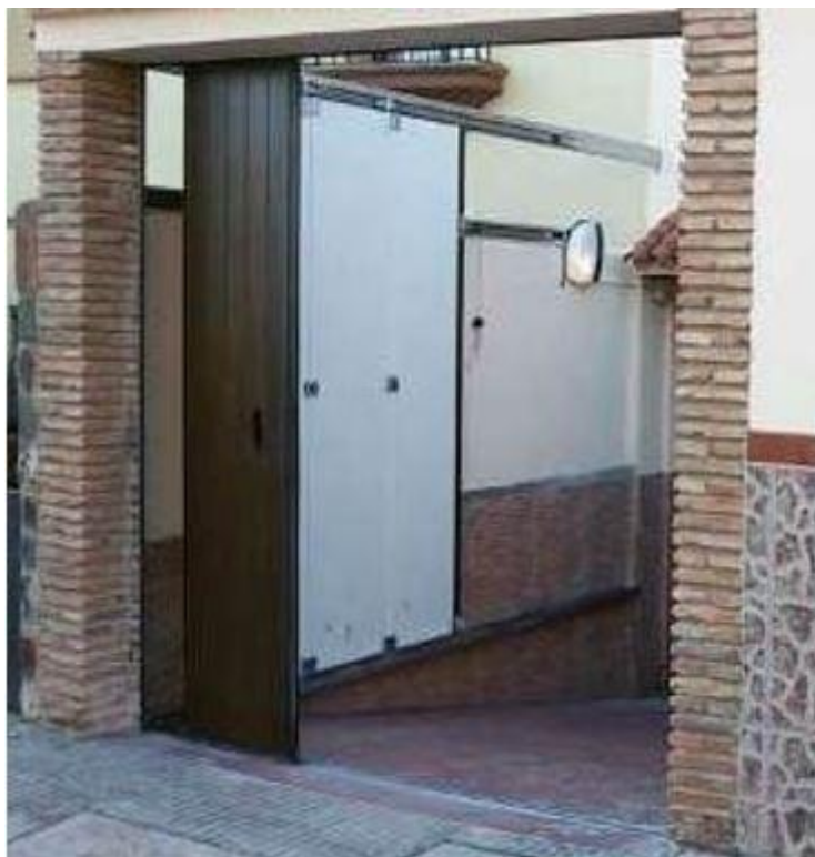
2. Tipos de puertas NO autorizables.

2.1 Puerta seccional, lama horizontal acabada en PVC imitación madera (cuarterones).