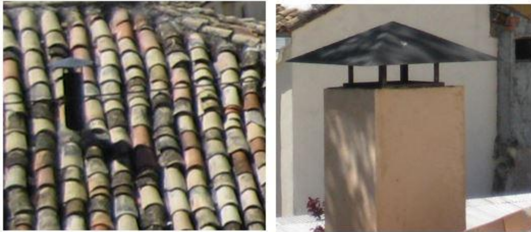
Imagen 1. Ejemplos de chimeneas con elementos metálicos permitidos.

Se prohíbe su ejecución con elementos metálicos brillantes (acero inoxidable, aluminio galvanizado o anodizado, etc.) así como los prefabricados de hormigón o chapados de piedra.