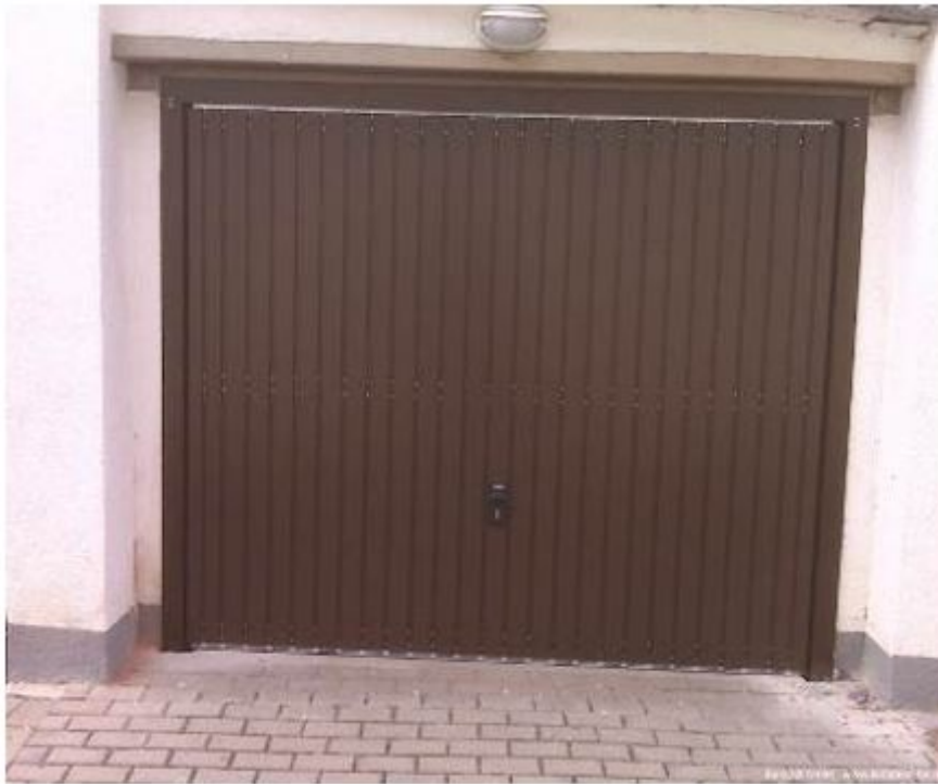
1.3. Puerta basculante de lamas metálicas verticales.