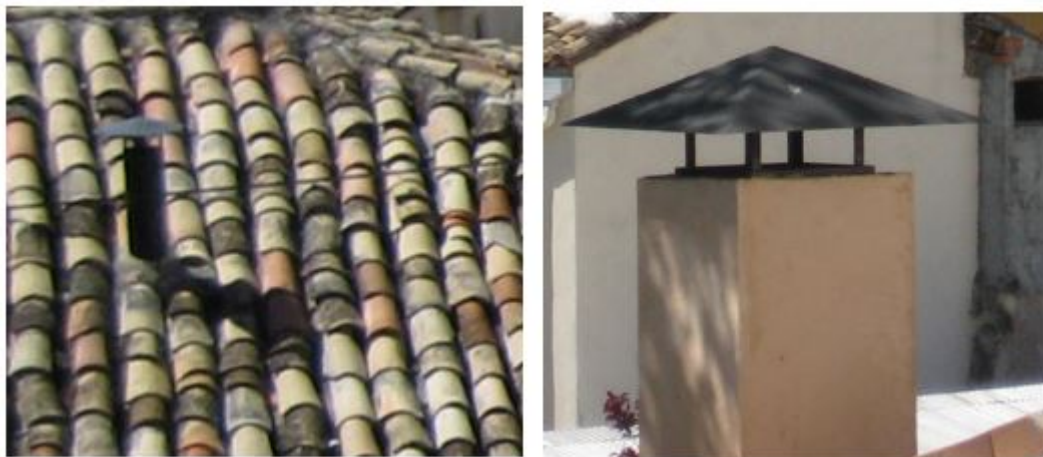
Imagen 1. Ejemplos de chimeneas con elementos metálicos permitidos.

Se permiten las chimeneas con salida directa del tubo siempre que éste sea en tonos oscuros y cuente con un remate con el mismo material.