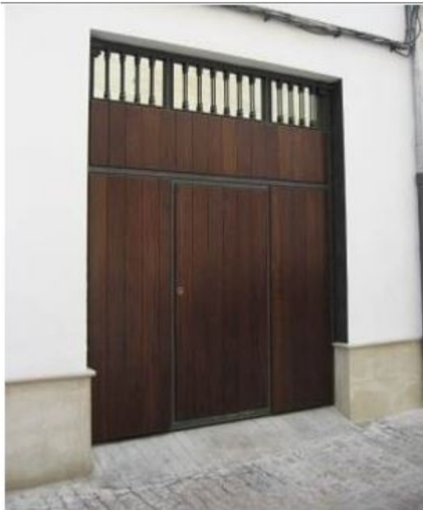
1.2. Puerta basculante, lamas de madera verticales, puerta peatonal integrada y bastidor metálico visto.