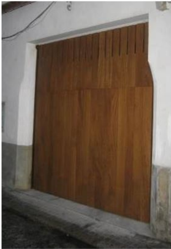
1.1. Puerta basculante, lamas de madera verticales y bastidor metálico no visto.