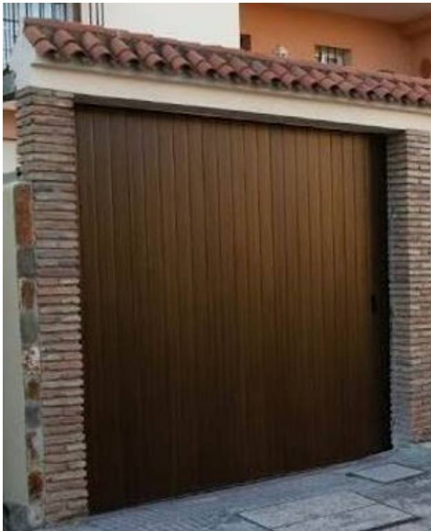
1.4. Puerta seccional (lateral), lamas verticales imitación madera