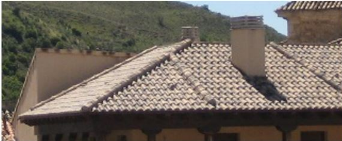
Imagen 2. Ejemplo de chimenea no permitida

adaptarán cuando se realicen obras para la reparación total de la cubierta.