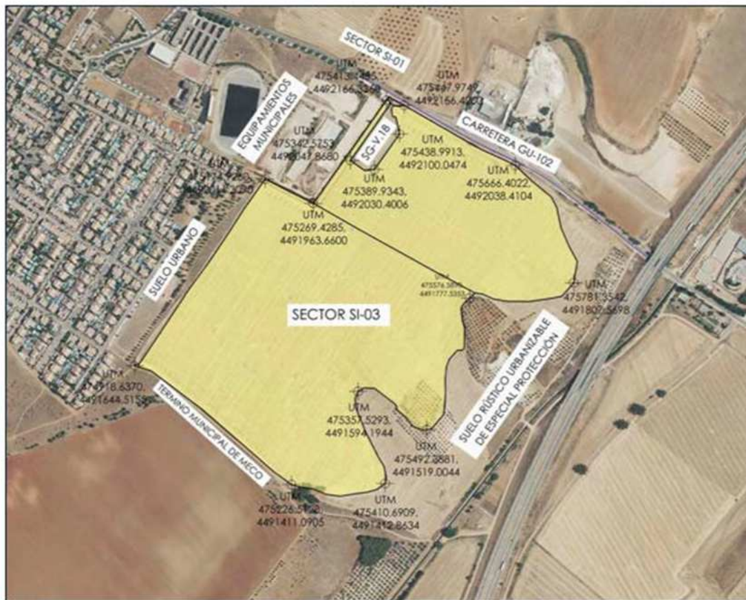
Plano delimitación PROPUESTA nuevo Sector SI-03. Villanueva de la Torre.