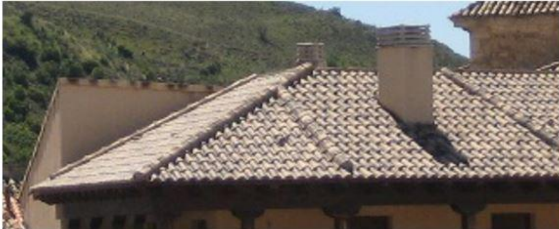
Imagen 2. Ejemplo de chimenea no permitida

Las chimeneas existentes que no se ajusten a lo anteriormente expuesto, se adaptarán cuando se realicen obras para la reparación total de la cubierta.