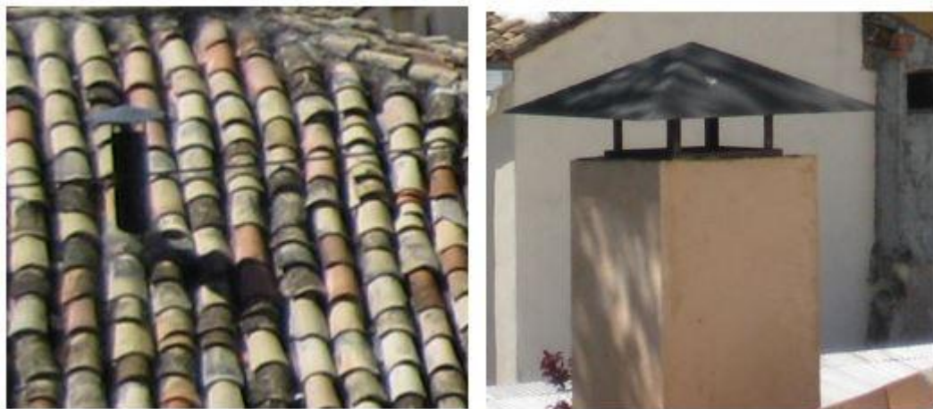
Imagen 1. Ejemplos de chimeneas con elementos metálicos permitidos.

Se permiten las chimeneas con salida directa del tubo siempre que éste sea en tonos oscuros y cuente con un remate con el mismo material.