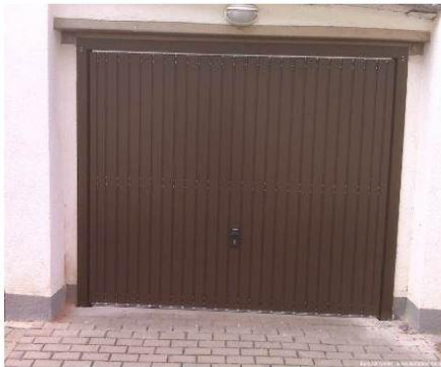
1.4. Puerta seccional (lateral), lamas verticales imitación madera